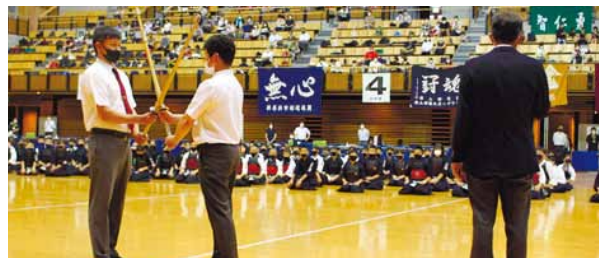
▲つばぜり合い解消方法について説明

愛媛県武道館を会場とした第53回愛媛県少年剣道大会では、午前：小学生、午後：中学生の2部制により、選手や応援者への検温、除菌、三密の回避など感染対策を講じながら、大会を運営しました。