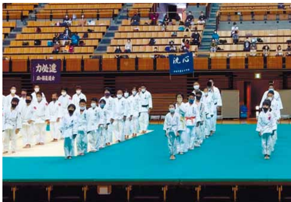
▲コロナ禍の中での大会開会式

本協会における昨年度の取り組みについて、大会実施の可否、開催した場合の感染対策、年間を通して選手の活動の機会の確保等々の課題に対し、多くの時間を費やし検討を重ねた結果、やむを得ず大会中止を余儀なくされたものもあったが、恒例の「あいテレビ杯女子柔道大会」等の幾つかの主要大会は感染状況を精査しながら、やっとの思いで開催にこぎ着けることが出来た。開催に際しては、感染のリスクを抑え込み、安全かつ有意義な大会となるよう、担当スタッフが丸となり、各大会ともにアクシデントなく結実し、多大なる収穫を得た。また、大会を根底から支え、感染対策に専門に取り組み、上述したことと同様に、裏方に徹したスタッフの存在は、今後の大会を遂行していく上でも、貴重なる存在となり得た。敬意を表すると共に、非常に有り難く、頭の下がる思いである。