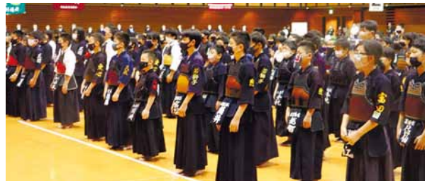
▲午前・午後に分かれての開会式

小学生の部、中学男子の部、中学女子の部の3部門で優勝を目指した戦いが繰り広げられ、白熱した試合が多く見られました。多くの大会が中止になる中、試合している選手は生き生きとしているように映り、応援の保護者の皆さんにも喜んでいただいたことと思います。大会結果は次のとおり。