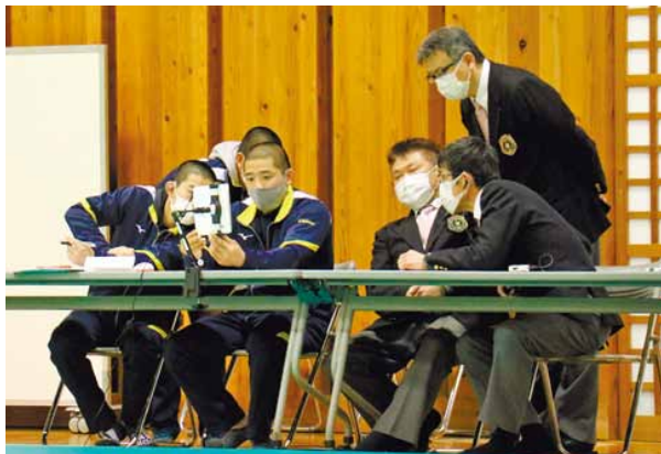
▲ コロナ禍の中での大会で服務する競技役員

柔道競技は武道の中でも、密接度の高い競技と言える。感染状況は変異株が検出される等、新たな局面を迎えている。現段階での感染者数は緩和傾向にあるが、まだまだ予断を許さないことは言うまでもない。このような状況の中で、今年度はサーモカメラを導入し、館内入場時における検温等の感染対策を徹底すると同時に、昨年度に作成された本協会の「大会における新型コロナウイルス感染症対策ガイドライン」を綿密に再点検し、先に行われた国際・全国大会等の成功実績や、(公財)全日本柔道連盟が示した指針を参考に、新たに作成した内容に基づき、今後の大会ならびに、来年度8月に愛媛県武道館で開催予定の「全国高校総体柔道競技」に向け、成功裏に導けるよう慎重に対策を講じていきたい。