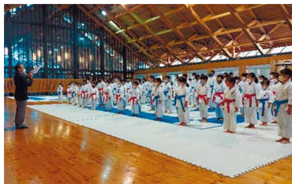
▲第52回愛媛県空手道選手権大会 開会式

愛媛県空手道連盟と愛媛県高体連空手道専門部とが連携して選手の強化・育成に励み、上位入賞を果たすことができるよう稽古に励んでいます。伊予三島運動公園体育館は愛媛県空手道連盟にとって、えひめ国体で空手道競技が実施された思い出の場所でもあります。その思い出の会場で再び、愛媛県選手団が活躍している姿を多くの方々にお見せすることができるよう精一杯、準備を進めていきたいと思っております。応援、よろしくお願いいたします。