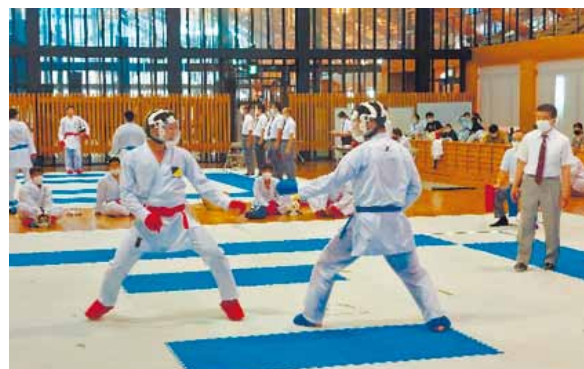
▲第52回愛媛県空手道選手権大会 成年男子組手決勝